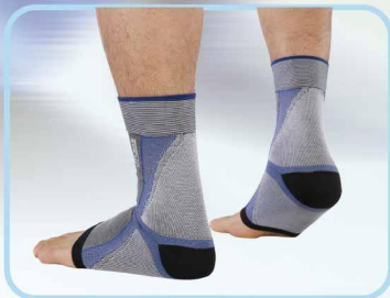
78006 壓力運動護腳踝 (規劃生產中) Compression open toe ankle socks