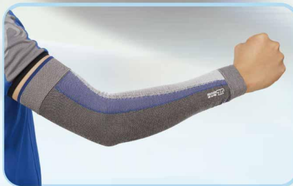
78004 壓力護全手臂 Compression arm sleeves