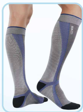
78001 壓力運動護踝小腿襪 Compression knee high socks