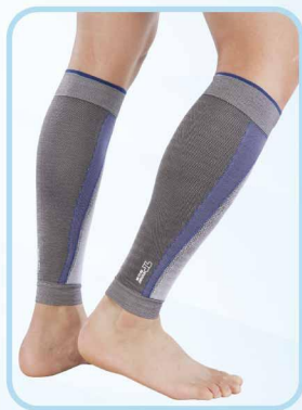
78002 壓力運動護小腿 Compression calf sleeves