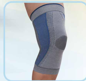
78005 壓力運動護膝 Compression knee sleeves