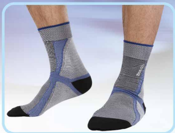
78000 壓力運動護踝短襪 Compression ankle socks