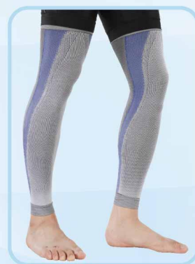
78003 壓力運動束全腿 Compression Sports Leg Sleeves